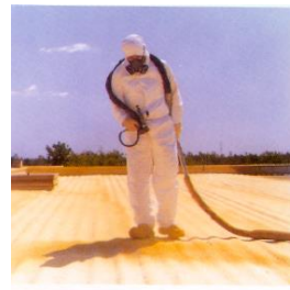
スプレー保温断熱材